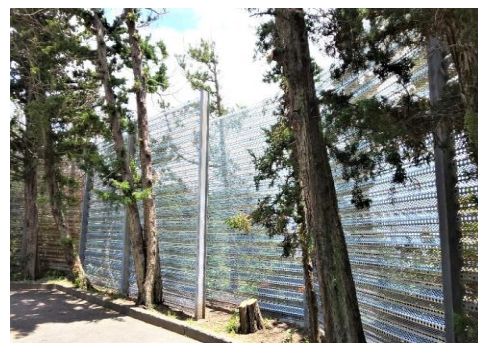
石白川線 防風柵改修後