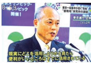
現実にとこを活用しようかを見たら 便利がいいところはすでに活用されている テレビ発言をする舛添都知事

ところが、舛添知事は「利用している人にとっては、駅前とか便利なところにあつたほうがいいんです。あんなへんびなど行くよりね」と発