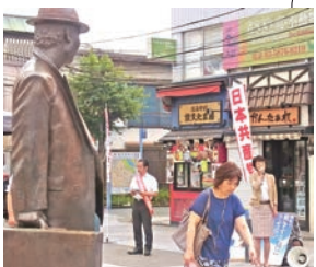
柴又駅前でも三小田区議と