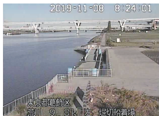
堀切船着場ライブカメラの映像

台風15号、19号と、被害があいこから河川の水位のつぎました。地球温暖化による異常気象のため激甚化しています。葛飾でも「避難勧告」がだされるなど、緊迫した事態になりました。10月28日の決算特