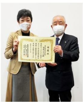
柏木会長から推せん状を受け取る和泉都議