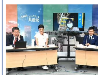
YouTube 動画『とことん共産党』