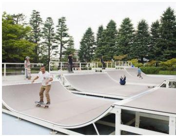
都内スケートパーク

九月三〇日、都建設局は和泉都議に対し、「葛飾区と協議のうえで区に対して水元公園のスケートボード広場の設置許可を出す予定」