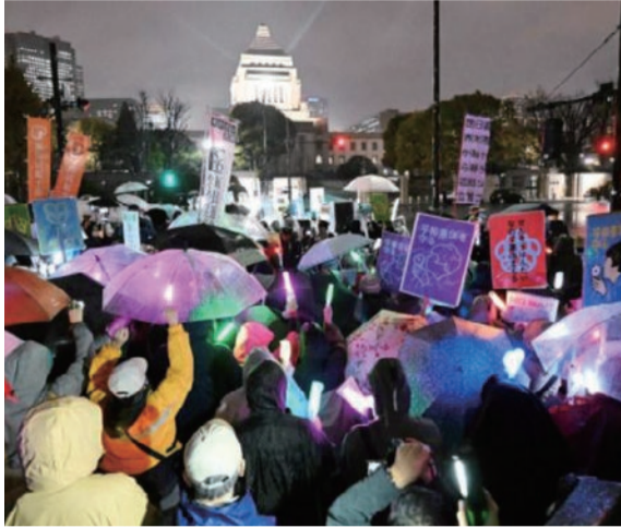
「今すぐ戦争をやめろ」「平和憲法を守れ」とコールする人たち=3月25日、国会前（しんぶん赤旗より）

3月25日本会議で、粕江市議会は、「イランをめぐる軍事行動の即時停止と外交による平和解決を求め」る決議を全会一致で可決しました。