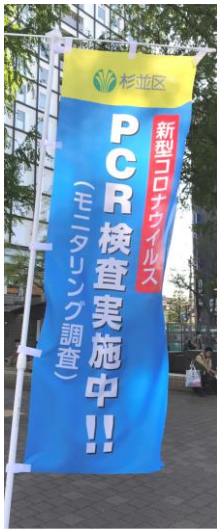
杉並区のPCR検査バス(下) 実施場所は2カ所・5日間実施