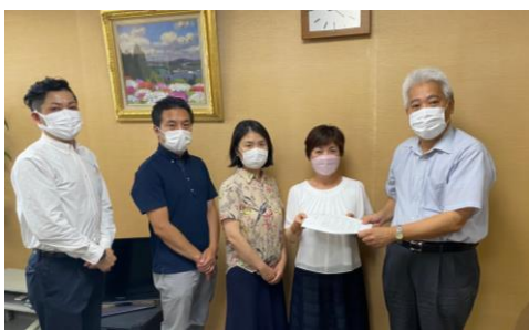
8月19日 教育長に申し入れ