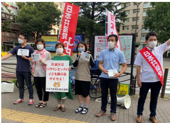
8月24日 阿佐ヶ谷駅前にて宣伝