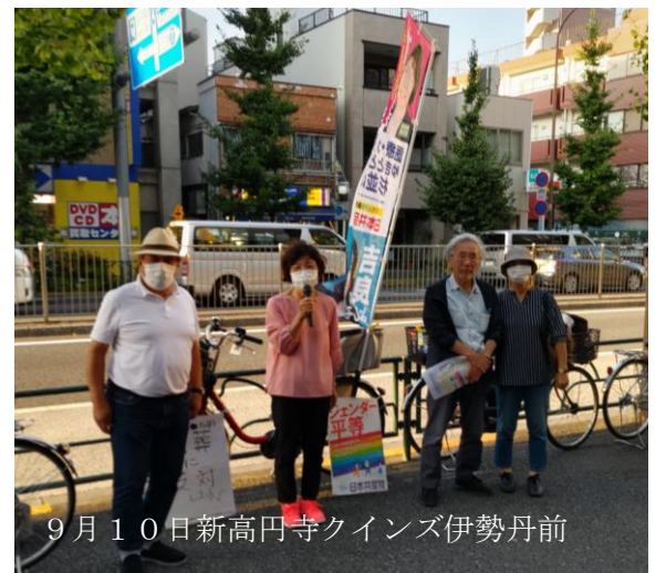
9月10日新高円寺クインズ伊勢丹前

質疑では、他区が公共性を考慮した上で利用者負担割合の低減を導入していることや減価償却費等を算定から除外し、使用料負担を軽減している事例を紹介。区の使用料を引き下げるよう求めました。 区は見直しを表明、近隣区との均衡等も考慮すると答弁しました。