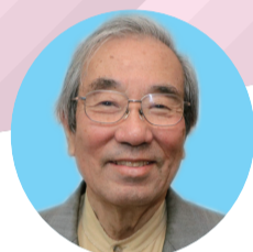
公明党元副委員長 二見 伸明