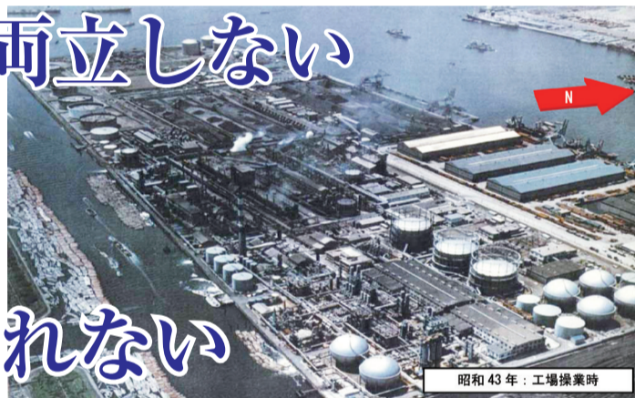
東京ガス製造工場操業時の写真。タールやヒ素など大量の有害物質が土壌深く染み込みました。

豊洲市場は「無害化」の見通しすらたっていません。知事は、専門家会議が提言した「追加対策」を施すといいますが、この「対策」は、汚染土壌が残ることを前提としたもの。「追加対策」で安全が確保されるかのようにいうのは、事実と反します。