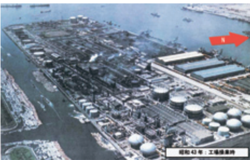
▲豊洲市場は東京ガス工場の跡地(操業時の写真)

そもそも、豊洲市場予定地は長年のガス工場操業により高濃度に汚染された場所でした。