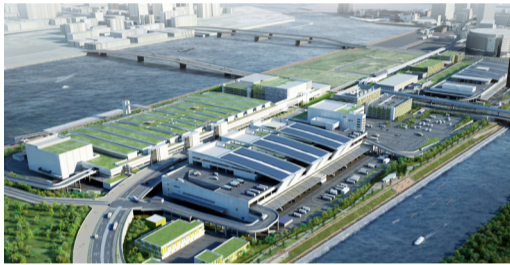
▲東京都中央卸売場のホームページより、完成イメージ図