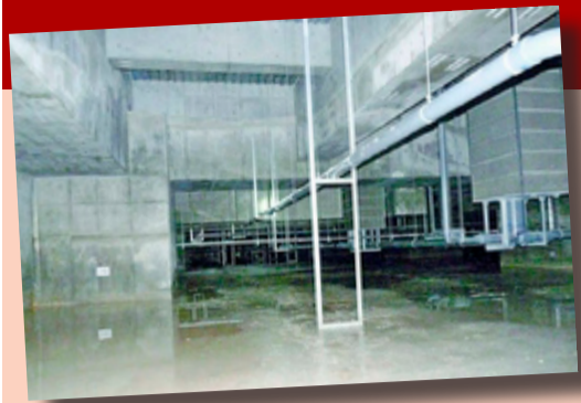
▲共産党都議団によって初めて撮影・公開された地下空間の写真