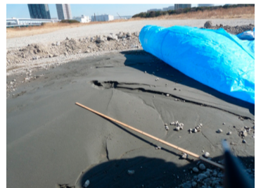
▲東日本大震災の時には、豊洲新市場予定地の敷地内で液状化により108箇所噴砂、噴水が発生しました。液状化で汚染が新たに地中に広がった恐れもあります。

東京都は最先端技術で汚染対策をしたとっていました。しかし実態は「盛り土」がなかったことに象徴されるように、実はいいかげんでした。そもそも、汚染された土壌が残っており、それがどこまで広がっているか、汚染された地下水はどうなっているのか、不明な点がたくさんあり、これからも有害物質が出てくる可能性が常につきまといます。仮に市場を開設した後に汚染がでたら、そのたびに大混乱が予想されます。市場は実験場ではありません。こんな場所に生鮮食品を大量に扱う市場をつくっていいのでしょうか。