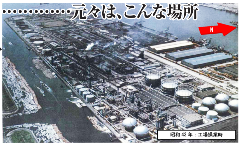
昭和43年：工場操業時