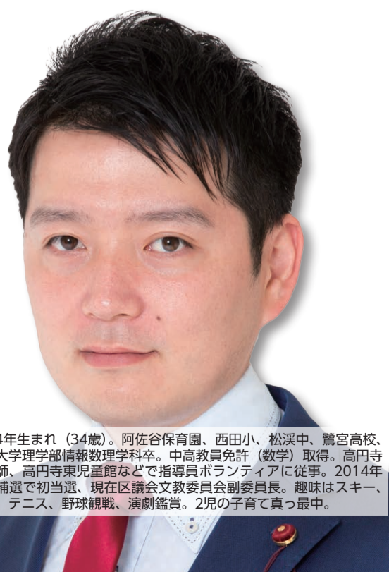
1984年生まれ（34歳）。阿佐谷保育園、西田小、松浜中、鷺宮高校、東海大学理学部情報数理学科卒。中高教員免許（数学）取得。高円寺塾講師、高円寺東児童館などで指導員ボランティアに従事。2014年区議補選で初当選、現在区議会文教委員会副委員長。趣味はスキー、卓球、テニス、野球観戦、演劇鑑賞。2児の子育て真っ最中。