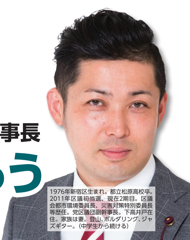
1976年新宿区生まれ。都立松原高校卒。2011年区議初当選、現在2期目。区議会都市環境委員長、災害対策特別委員長等歴任。党区議団副幹事長。下高井戸在住。家族は妻、登山、ボウリング、ジャズギター。（中学生から続ける）