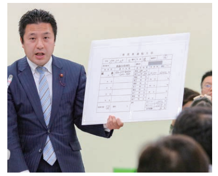
徹底調査をもとに区長の公用車乱脈利用の実態を告発

日本共産党杉並区議団は、区長が公用車を選挙応援に利用し、深夜まで乗り回している実態を告発。多くのマスコミが報道しました。その結果、区は23区で初めて区長車の使用基準を作ることになりました。今後も、税金の浪費を正すために全力を尽くします。