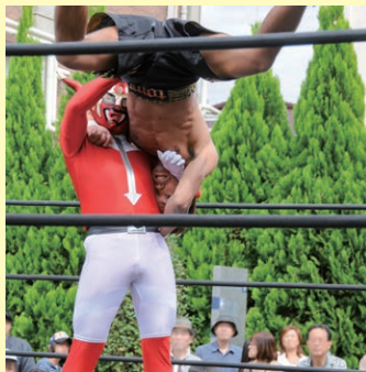
↑商店街イベントにて。 赤いマスクマンが私

←毎年、荻窪消防団操法大会に選手として参加しています。2018年度大会では優勝しました。