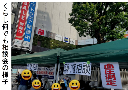
くらし何でも相談会の様子

暑いし、相談に来られる方は少ないかなと思っていたのですが、1時間半で30人ほどの方が来られました。安定した住まいがなく、ネットカフェで生活しておられる方や、住まいを失ったばかりという方をはじめ、病気や生活、法律、労働など、